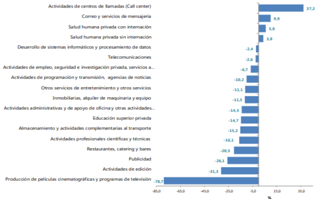
Gráfico No. 3: Variación anual de los ingresos nominales, según subsector de servicios Total Nacional Octubre 2020p

De acuerdo con el último boletín publicado por DANE de octubre 2020, se tiene que el subsector de servicios, específicamente en las actividades profesionales científicas y técnicas, durante el mes de octubre de 2020, se registró un decrecimiento del 16,1% en los ingresos nominales, destacándose el incremento de las actividades de centro de atención telefónica (37,2%) y correo y servicio de mensajería (9,9%). Por el contrario, los sectores que en octubre de 2020 presentaron las mayores caídas en sus ingresos fueron el de producción de películas (-78,7%), actividades de edición (-31,3%) y publicidad (-26,1%).