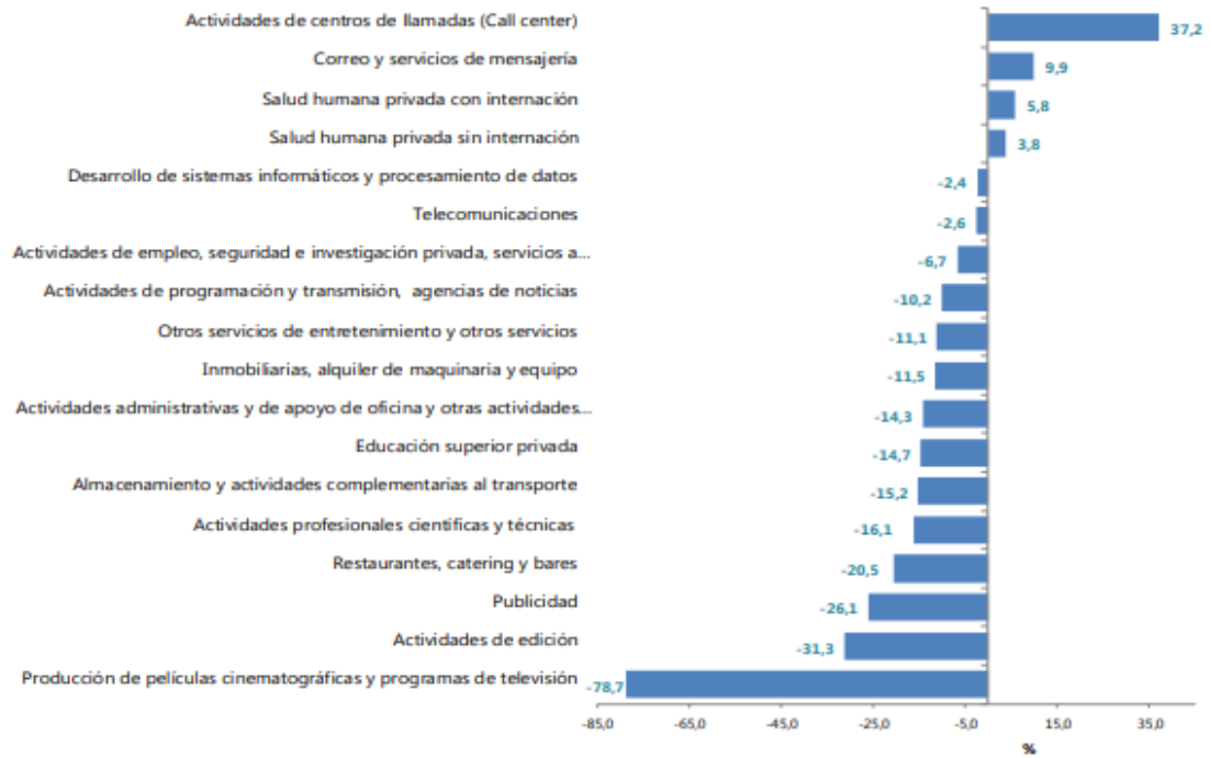
Gráfico No. 3: Variación anual de los ingresos nominales, según subsector de servicios Total Nacional Octubre 2020p